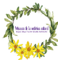
Imagen creada para promocionar los productos elaborados con plantas medicinales por las mujeres participantes en los procesos.

Las mujeres visualizan a través de la formación-organización la posibilidad de elaborar productos para la comercialización en sus comunidades, como un aporte a su empoderamiento económico.