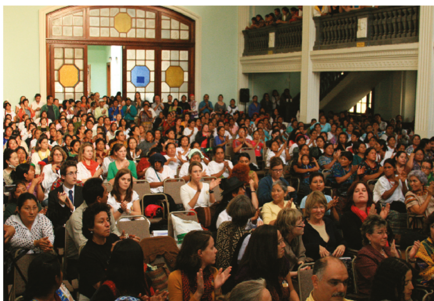
Fotografías Tribunal de Conciencia año 2010